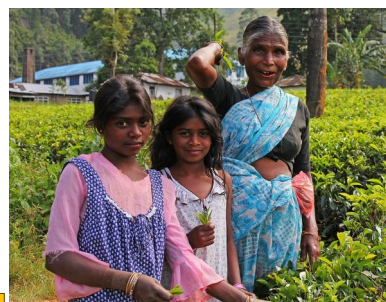
Fra en teplantasje på Sri Lanka.

Jeg gikk på skolen opp til GCE A /L (grunnskole på Sri Lanka)Jeg hadde et stort ønske om å få en yrkesopplæring, men med lav inntekt er det ikke enkelt. Gjennom en venn fikk jeg vite at KPMCC ikke tok betalt for sine kurs så jeg sendte en søknad og fikk komme til intervju. Så var jeg så heldig å få plass på grunnleggende datakurs. Trives godt på skolen og vil søke på neste kurs som er NVQ (National Vocational Qualification) nivå 4 som vil gi meg større mulighet både til å søke jobb og høyere utdanning. Jeg takker ledelsen til KPMCC og Norge som bidrar til at vi kan gå på skole her. Jeg har en bønn om at dette gode arbeidet kan fortsette i fremtiden.