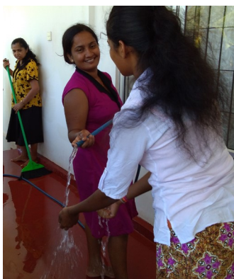
Alle elevene må bidra med å holde det rent på senteret vårt i Trincomalee.

Vi ønsker å komme med litt informasjon fra oss. Vi vil fortelle dere noe av det som har hendt det siste halvår. Siden desember har det vært stor aktivitet rundt i landet vårt og på Sri Lanka. Avdelingene i Oslo/Akershus, på Hedemarken, i Molde og omegn og i Tønsberg og omegn sender varme tanker til dere alle sammen. Likeledes takk for bidrag med pantlapper, gaver til loddsalg, barnehager/skoleaksjoner og andre aktiviteter.